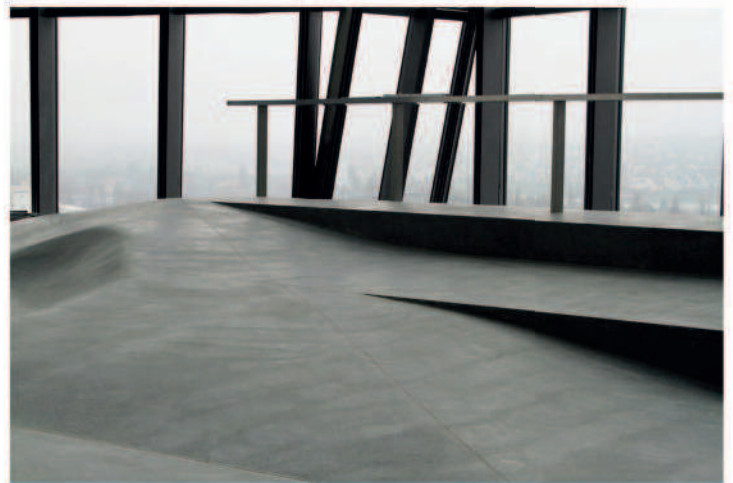
Terrazzolandschaft in der EZB Frankfurt