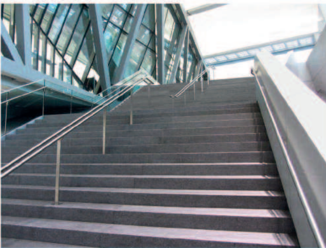
Treppenstufen aus Terrazzo in der EZB Frankfurt

Grundreinigung, Oberflächenversiegelung und Rissanierung zur Revitalisierung und Werterhaltung von Terrazzo und Designestrichen