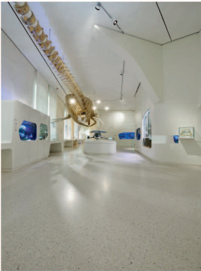
Terrazzo im Naturkundemuseum Karlsruhe

Unsere Eigenentwicklungen aus der Pavinodis® Produktreihe bieten durch den Einsatz verschiedener Bindemittel und Zuschläge nahezu unbegrenzte Gestaltungs- und Einsatzmöglichkeiten. Mit bestem handwerklichem Wissen und jahrzehntelanger Erfahrung schaffen wir Böden, die technische als auch architektonische Anforderungen perfekt umsetzen.